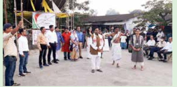
स्वच्छता पखवाड़ा 2021 के दौरान बीवीएफसीएल कर्मचारियों द्वारा निभाया गया नाटक का एक दृश्य A scene of Natak played by BVFCL employees during Swachhta Pakhwada, 2021