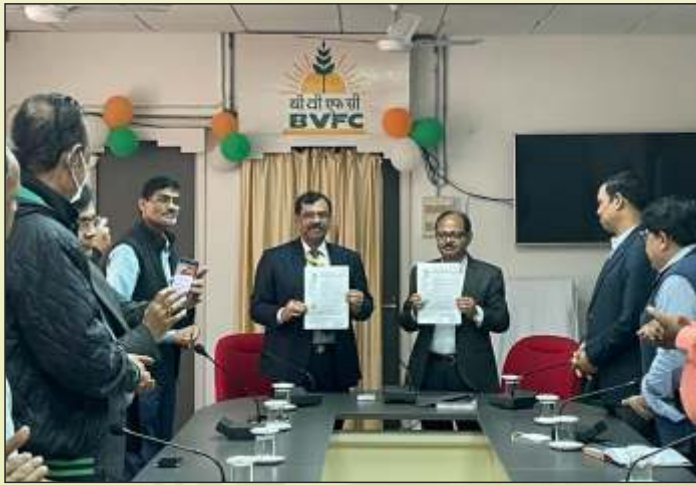
पूर्वोत्तर राज्यों में एनपीके उर्वरक के विपणन के लिए बीवीएफसीएल ने एचआईएल के साथ समझौता ज्ञापन पर हस्ताक्षर किए। MOU signed by BVFCL with HIL to market NPK Fertilizer in NE States