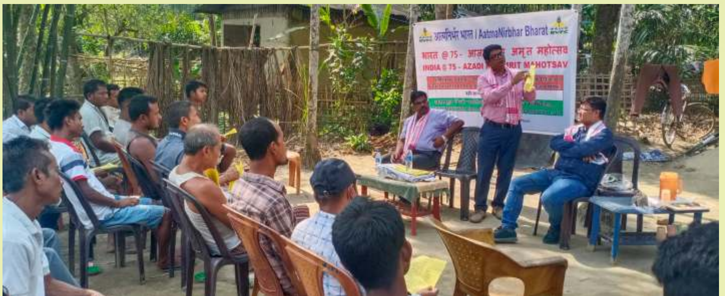
कृषि के लिए उर्वरकों के संतुलित उपयोग के बारे में किसानों को जानकारी देते हुए। Sharing information to farmers for balance use of fertilizers for Agriculture