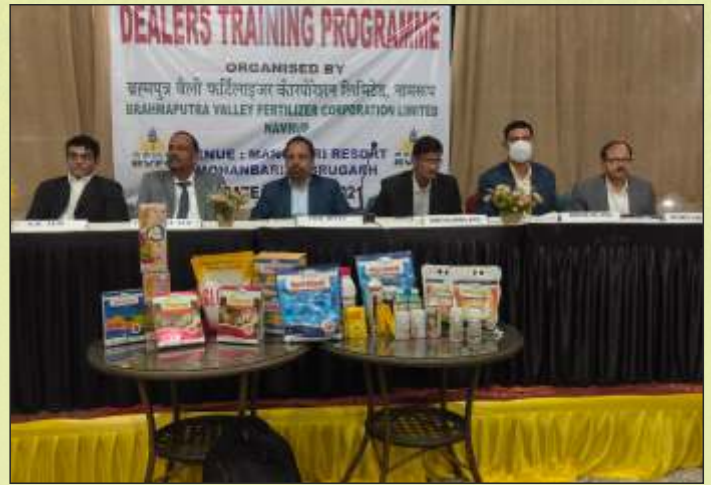
डिब्रूगढ़ में हुए डीलर्स ट्रेनिंग प्रोग्राम के दृश्य। Scenes of Dealers Training Programme held in Dibrugarh