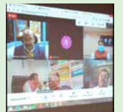
विडियो कॉन्फ्रेंस के माध्यम से बीवीएफसीएल की 18वीं वार्षिक आम बैठक का एक दृश्य। A scene of 18th Annual General Meeting of BVFCL through Video conference