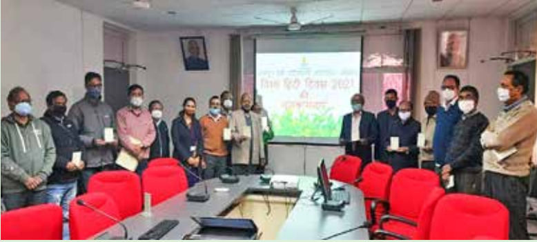
विश्व हिंदी दिवस 2021 पर हिंदी को लोकप्रिय बनाने के लिए अधिकारियों के बीच हिंदी शब्दों का छोटा टेबल स्टैंड वितरित किया गया। On World Hindi Day, 2021 Small table stand of Hindi words distributed among Officers to popularise Hindi