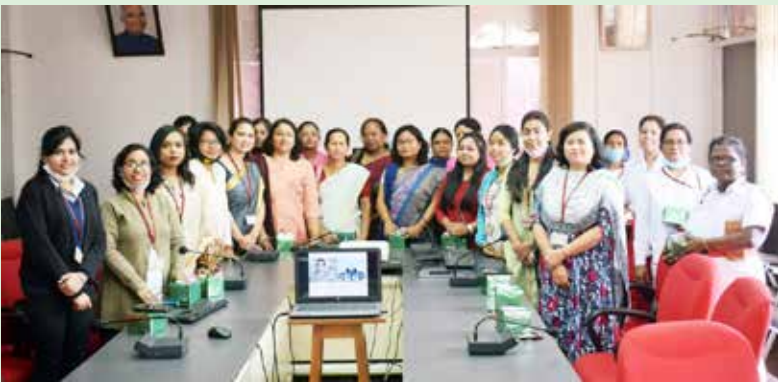
बीवीएफसीएल की महिला कर्मचारियों का एक समूहिक चित्र। A group photo of women employees of BVFCL