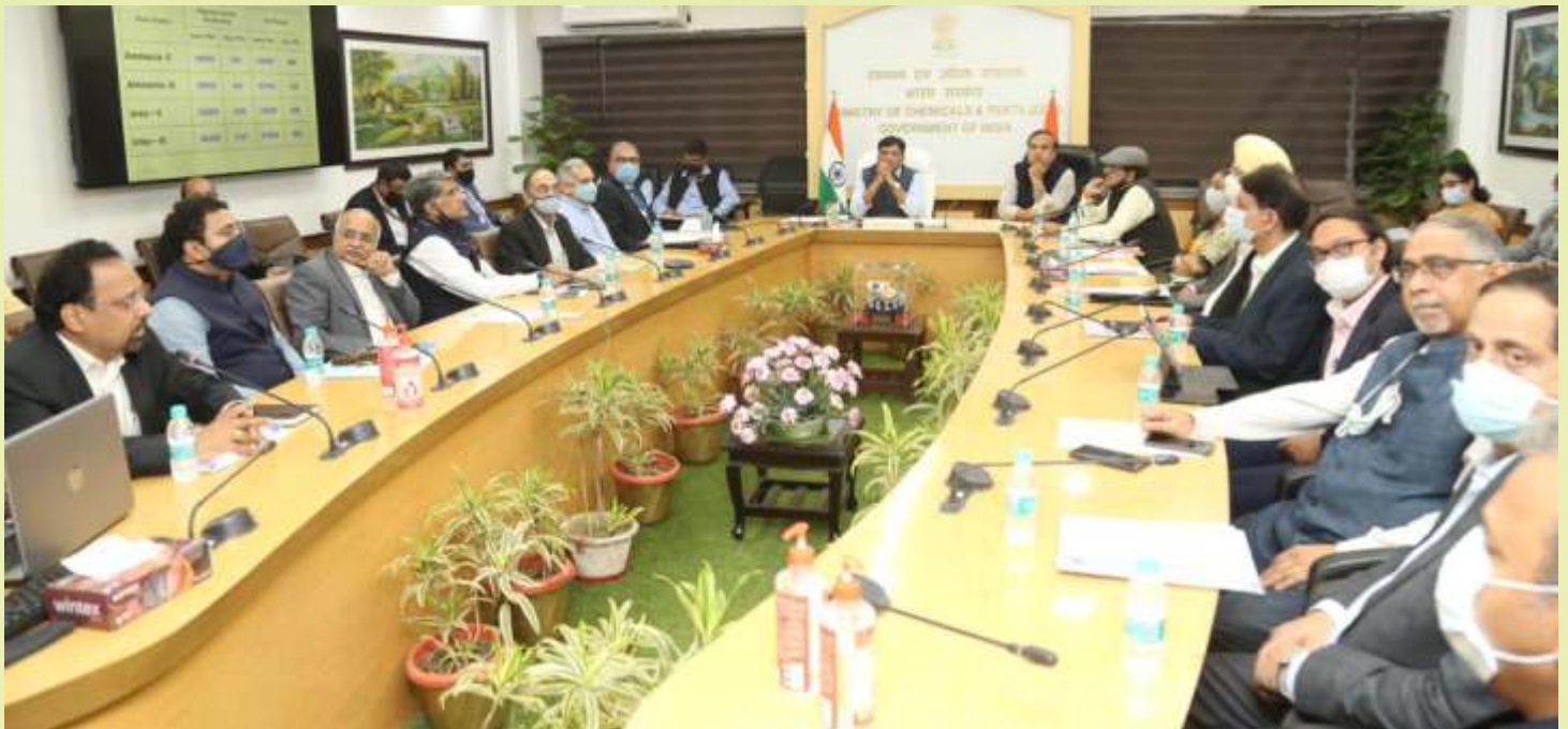
माननीय केंद्रीय मंत्री उर्वरक और रसायन, असम के मुख्यमंत्री, उर्वरक विभाग और उर्वरक कंपनियों के अधिकारियों के साथ नामरूप-IV परियोजना पर चर्चा करते हुए Hon'ble Union Minister of Fertilizers and Chemicals, Chief Minister of Assam discussing on Namrup-IV Project with officials of DOF and Fertilisers Companies